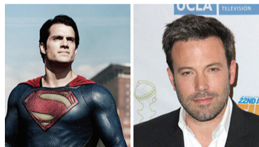
新超人(左)说期待和小本合作。