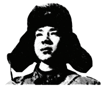
学习雷锋 奉献他人 提升自己