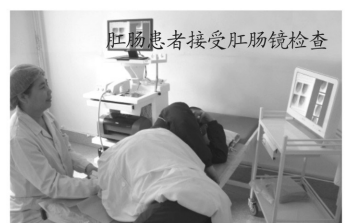
肛肠患者接受肛肠镜检查

省内患者可拨打“全国肛肠疾病救助工程中国行”河南站救助专线0371-63523333，申请彩色超导光肛肠镜免费检查。