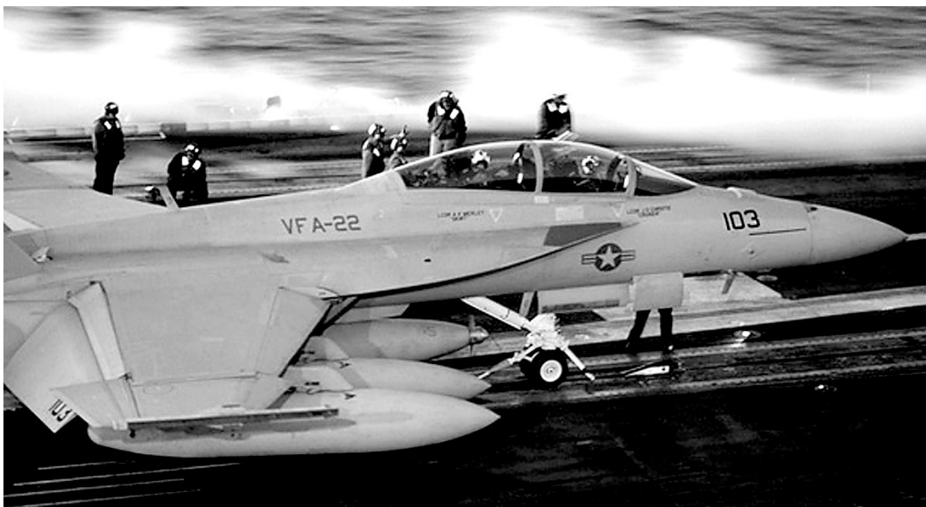
只需奥巴马一声令下,美国战机立即发动打击

奥巴马一年前把叙利亚使用化武列为逾越“红线”之举,目前美国政界要求对叙利亚实施军事干预的呼声高涨,但民调显示大约60%的美国民众认为美国不应军事干预叙利亚冲突。叙利亚部分邻国和俄罗斯等国也坚决反对西方国家实施军事干预。