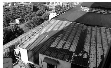
楼顶酒店的房顶被黑色的防雨布覆盖着