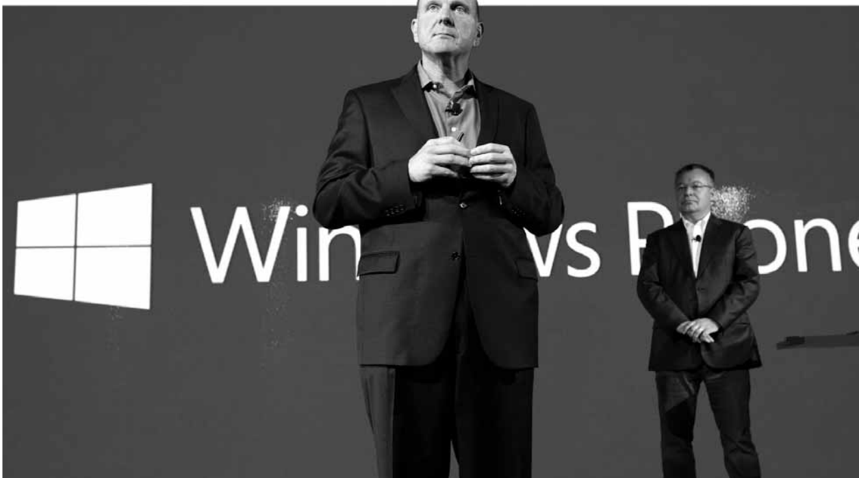
微软首席执行官鲍尔默(前)宣布将在一年内退休，诺基亚现任首席执行官埃洛普成为微软新掌门的热门人选。

微软此次收购诺基亚，在业内人士看来，将与苹果、谷歌一道，成为同时拥有操作系统、应用平台和硬件的三大智能手机巨头之一（全球手机霸主三星没有自己的操作系统），将使 Windows Phone 8 实现“软硬一体”，微软将能够