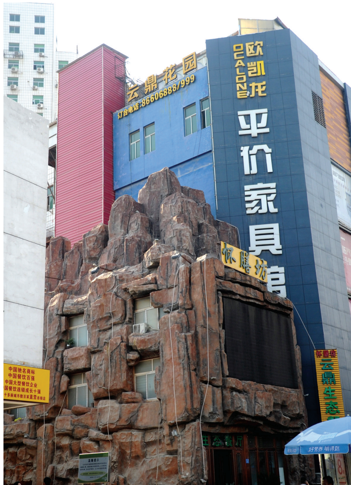
云鼎花园酒店。