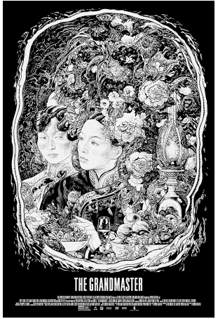
艺术家 Vania Zouravliov 设计的复古版海报,选取宫二在金楼等待叶问的场景。