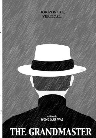
雨中的叶问:艺术家 Joris Laquittant 的作品。