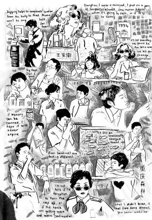
《重庆森林》:Poppy设计,把片中各个人物的状态、经典台词拼贴在一起。

《一代宗师》在北美上映,在海报设计界也引发一场王家卫热,插画师、设计师纷纷出手。