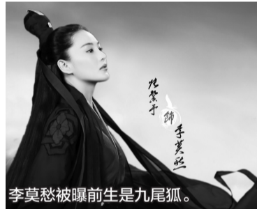
李莫愁被曝前生是九尾狐。