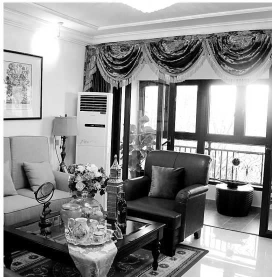
恒大绿洲样板间实景