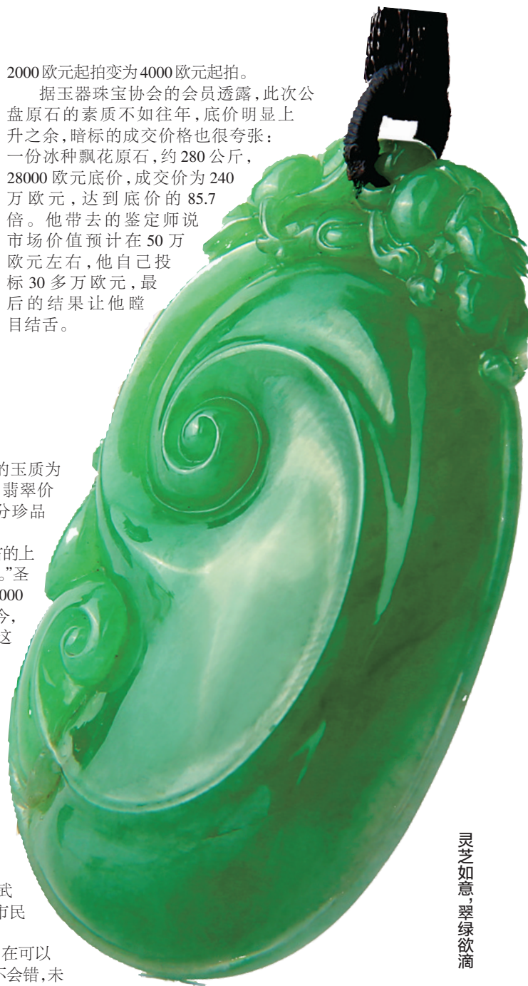
灵芝如意,翠绿欲滴

在业内人士看来,不管是搞收藏还是个人佩戴,在可以预见翡翠价格上涨的前期,入手喜欢的翡翠产品准不会错,未来翡翠产品的增值空间仍将继续扩大,的确是个难得的机会。