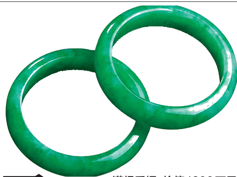
满绿手镯,价值1600万元