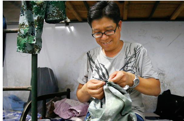
深夜一位男老师还在给学生修补衣服

行为学家研究表明14至21天就能养成一种习惯,如果有可能,希望这场洗礼,时间再长一些,过程再慢一些。使每个孩子都能让优秀成为一种习惯。