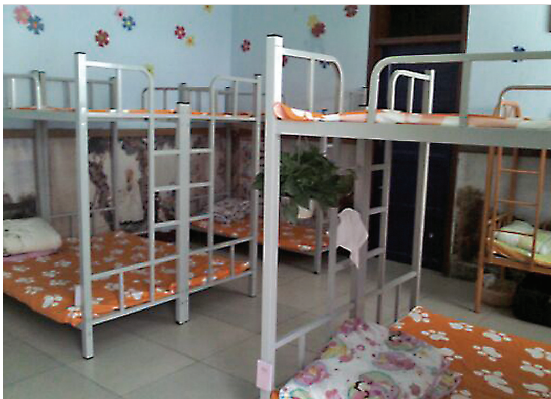
金水区纬五路一小附近一午托班