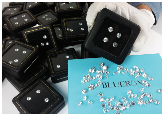
一枚晶莹剔透的克拉钻成为很多成功人士的象征,本次活动特别准备了 500 多颗高级克拉钻,最低售价仅 25999 元,省钱 5 万多。

极度闪耀的克拉钻,被称为“钻石之王”,不仅彰显高贵身份,更因全球都稀缺,每年都在以 15%~20%速度升值。有调查显