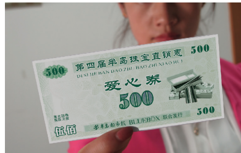
花 20 元购买一张“爱心券”,凭“爱心券”买钻,不仅能奉献爱心,还能当场减 500 元。

据了解,本次推出的 20 元抵 500 元的“爱心券”,为方便市民,今天起市民可拨打 2 部热线 56729733、55030999 申请预留,活动开始当天领券,直接抵 500 元现金。“爱心券”共发行 1000 张,现仅剩 600 张,有需要的市民赶紧打热线抢购,每人限预留 1 张,预订完为止。