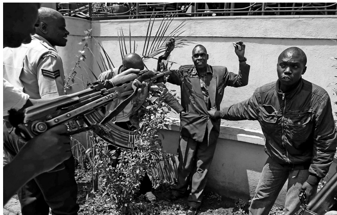
9月21日，警察搜查走出购物中心的一名男子。