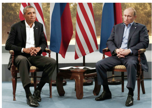
← G8峰会上的普京和奥巴马,两人的表情显示俄美关系的现状。

以上地区处在普京规划的“莫斯科自由贸易区”以及军事联盟“欧亚联盟”的核心,实现以上两个经济