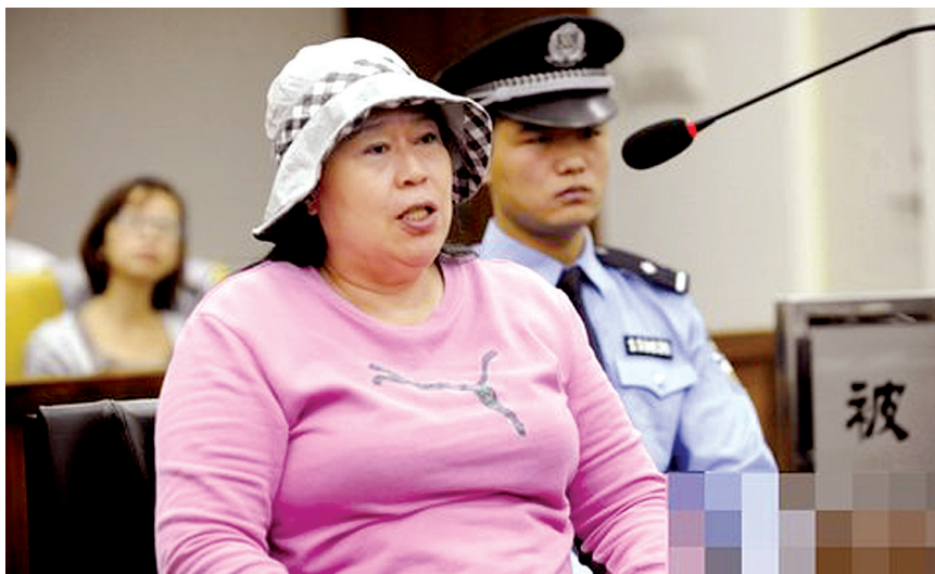
房姐 高铁一姐 同日受审