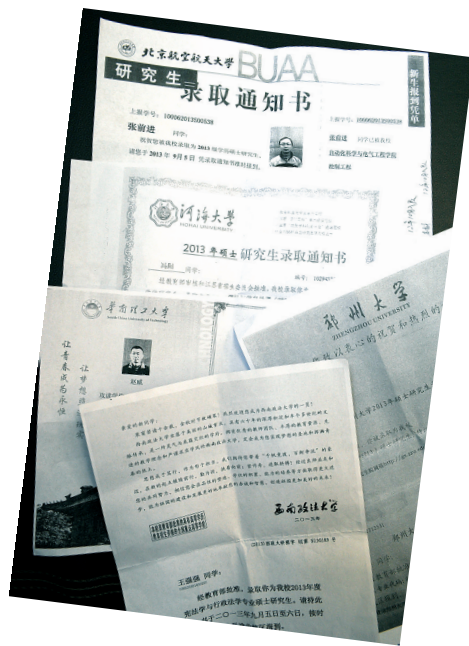
5名保安的研究生录取通知书

4年来还有2名保安考上研究生 18名保安考上公务员或通过司法考试 不少人去郑大保卫处打听:还招人吗?