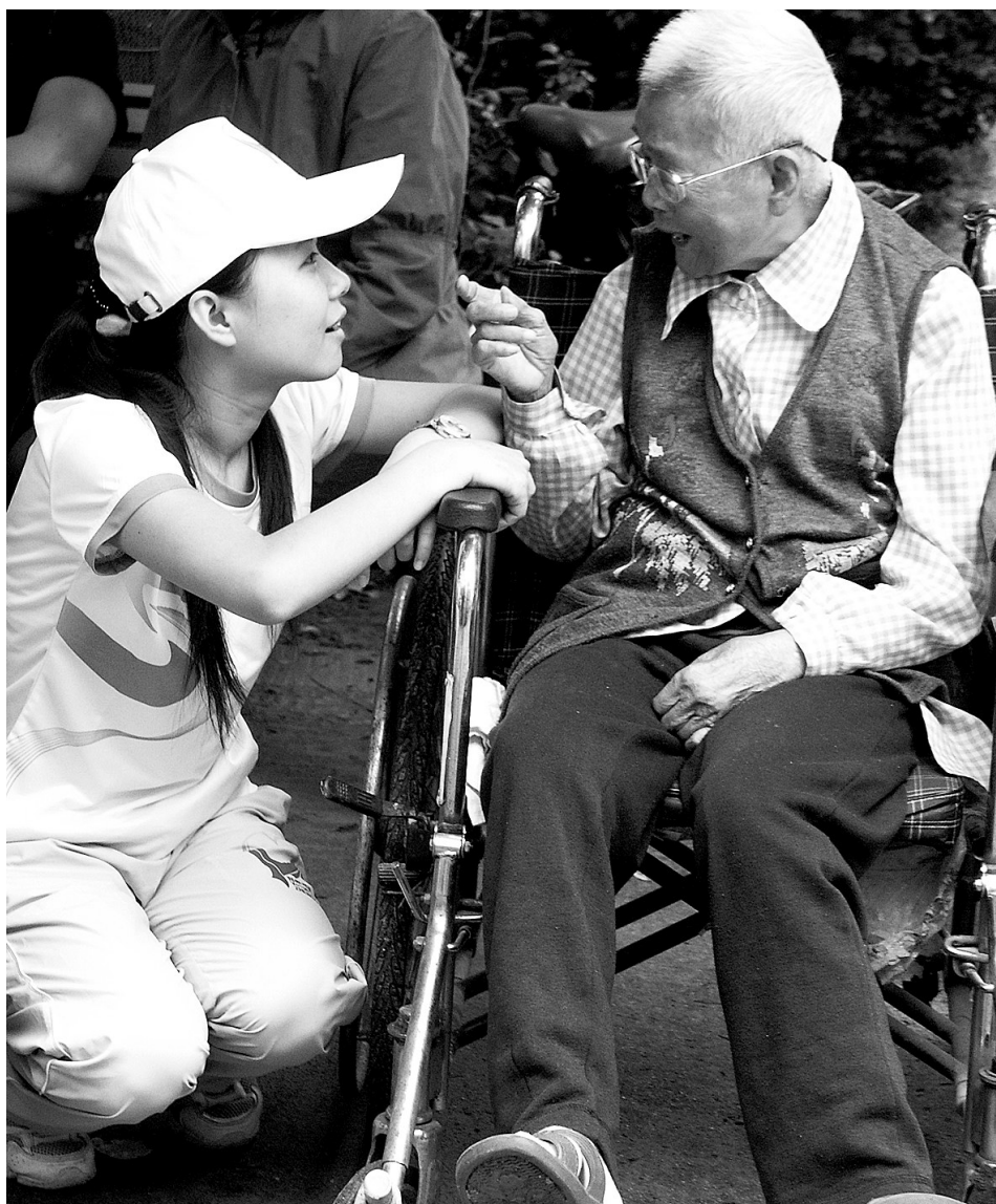
慈善志愿者来到老人身边,与他们谈心,为他们解闷。