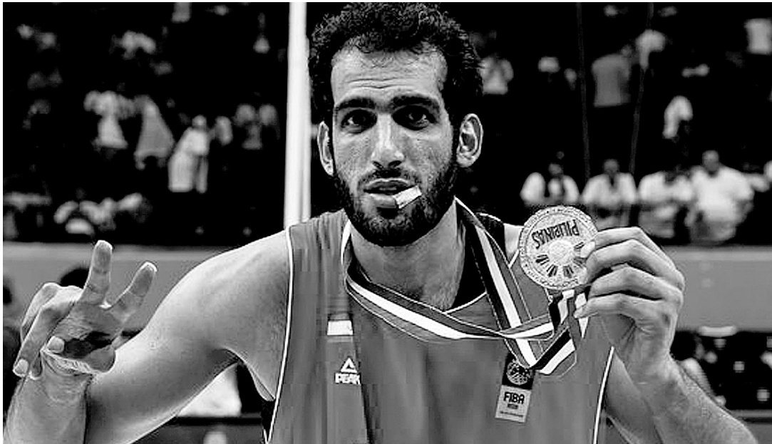
哈达迪一来,易建联CBA第一人的地位将受到威胁

此前《亚洲篮球网》就曾爆料哈达迪有望与CBA的一支球队签约,合约价格达到120万美元,但当时并没有明确指出他会加盟哪支球队。昨天该网站再次跟进了这个消息,明确表示签约哈达迪的是有望成为CBA升班马的四川队。