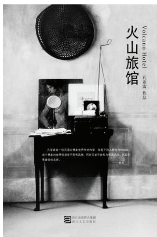
《火山旅馆》,孔亚雷著,浙江文艺出版社 2013年7月版