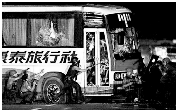
2010年8月23日发生的马尼拉人质事件轰动香港。(资料图片)

7日下午,正在出席亚太经合组织领导人非正式会议的梁振英在巴厘岛与菲律宾总统阿基诺三世会面约40分钟,商讨人质事件,他在席间转达了死者家属、伤者及香港社会的看法,亦转达了家属及伤者的要求,包括道歉、赔偿、惩处及保证同类事件不再发生等。