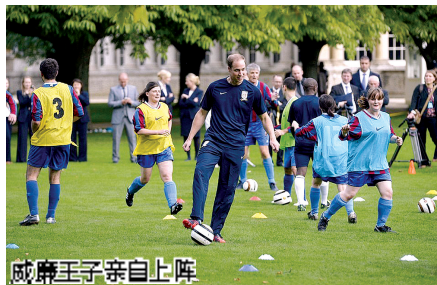
威廉王子亲自上阵

伦敦白金汉宫一直是英国王室禁地。昨天,白金汉宫向草根足球运动员敞开大门,并首次举办了一场足球赛,以纪念英足总成立150周年。