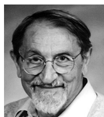
▲马丁·卡普拉斯 1930年3月15日出生

2002年,85岁的约翰·B·芬获诺贝尔化学奖。这使他成为目前获得诺贝尔化学奖年龄最大的人。中新