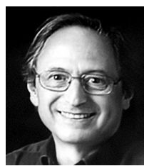
▲1957年5月5日出生 迈克尔·莱维特

生于奥地利,拥有美国和奥地利双重国籍。主要研究是在核磁共振谱学、化学动力学、量子化学和生物大分子的分子动力学模拟方面。提出了有关耦合常数和二面角之间关系的卡普拉斯方程。1979年起,担任哈佛大学的化学教授。