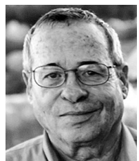
▲1940年11月20日出生 亚利耶·瓦谢尔