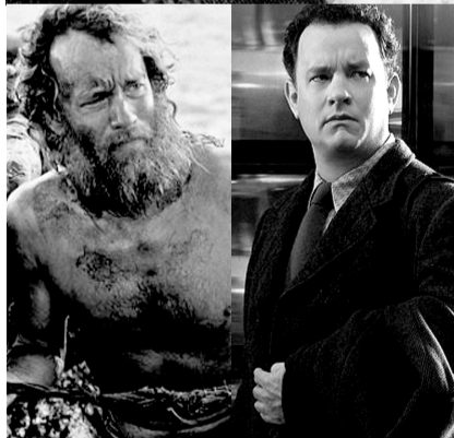
在《荒岛余生》《幸福终点站》中，汉克斯的体重有很大的起伏。