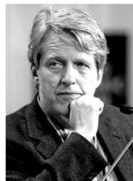
罗伯特·J·席勒,他是耶鲁大学亚瑟·奥肯经济学教授。代表作有《动物精神》和《非理性繁荣》。

400年前,奇人陈一堂,首创断痒绝方,据记载:明万历年间神宗痒痒难捱,众御医无良策,陈氏族族长陈一堂被特邀入宫,涂其独创秘制黄色药膏,半炷香功夫,奇痒全消,龙颜大悦。陈一堂断痒拔毒膏400年间,陈氏家族不断改良,历久弥新,2008年,陈氏传人将此方献出,经过现代医学加工,密炼成膏,独具3大特点:①作用迅速,抹上15秒药膏神秘消失,快速止痒;②深层拔毒,把潜藏于体内风、寒、暑、湿、燥、火、虫等邪毒连根拔出,断痒不留根;③纯中药消杀,无刺激、不过敏。无论是春夏过敏痒、脚气钻心痒、皮炎灼热痒、湿疹糜烂痒、风疙瘩痒、刺痛痒、糖尿病全身痒,还是脱皮干痒、阴囊湿痒、肛周痒、内外阴痒……抹此膏快速断痒,百试百灵!