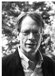
拉尔斯·皮特·汉森,芝加哥大学教授。他最主要的贡献在于发现了在经济和金融研究中极为重要的广义矩方法。