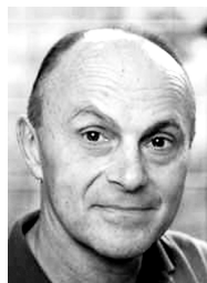
尤金·法马,美国著名经济学家,专长于现代投资组合理论与资产定价理论,因提出“有效市场假说”闻名。