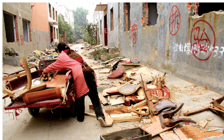
嘉嘉妈妈在拆迁的城中村内拾废品