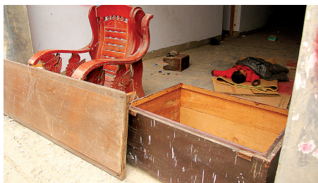
嘉嘉两岁的弟弟在地上睡着了