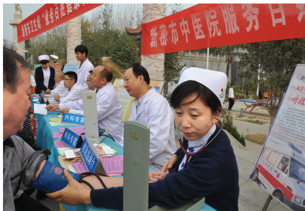
►新密市中医院经常开展社区义诊健教活动