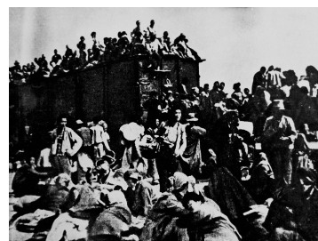
上世纪40年代乘火车逃难的人群。