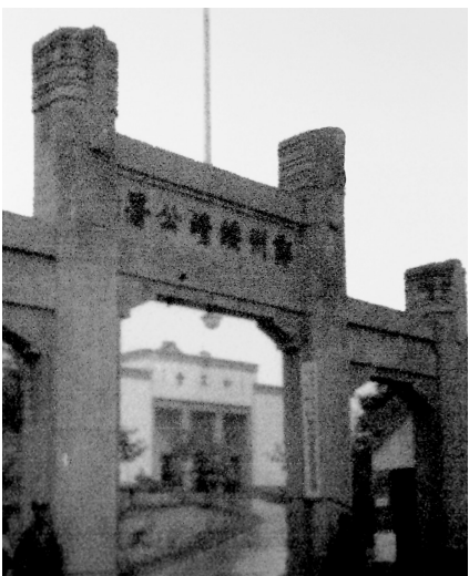
位于大同路东侧的郑州绥靖公署。

1948年7月 ，蒋介石飞抵郑州，在华美医院召见驻郑陆军总司令顾祝同。顾祝同按照蒋介石的指示，将1946年以来关押在郑州各监狱服刑的所有重要的政治犯近500人都集中到河南省第二监狱，随时准备枪决。敌人在监狱四周，五步一岗，十步一哨，层层包围。狱内早就架好机关枪，只要解放军可能攻打郑州，敌人就对所有同志用机枪点名。监狱地下党支部密示战友：“准备好，现在只有硬拼了。等解放炮声震响，立刻放火烧监狱，打开血路冲出去！”