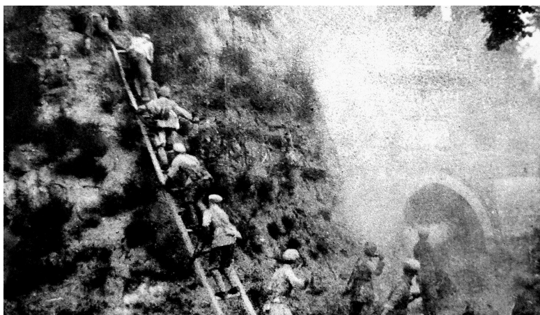
解放郑州部队在进行攻克城墙训练。