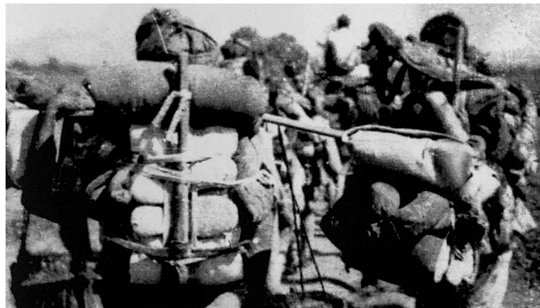
参加解放郑州战役的部队在急速前进。

1948年9月24日,济南战役即将结束之际,华东野战军代司令员粟裕不失时机地致电中共中央军委并上报华东局、中原局,提出发起淮海战役。