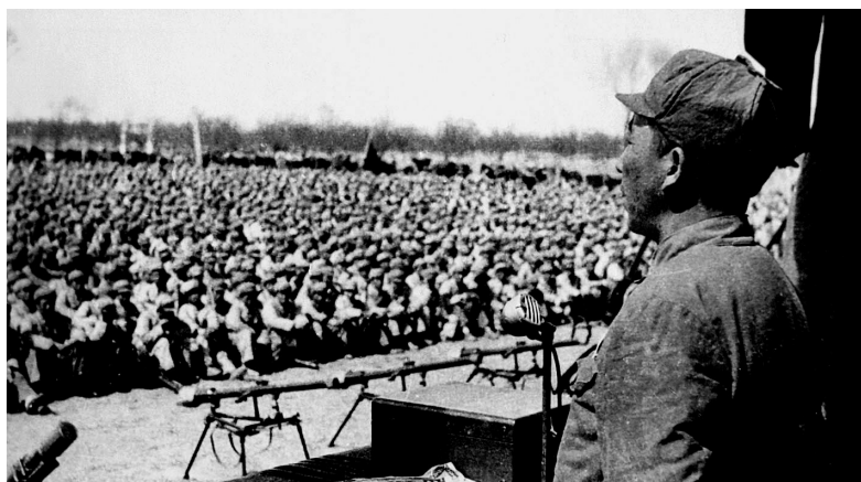
中原野战军九纵司令员秦基伟作战前动员报告。