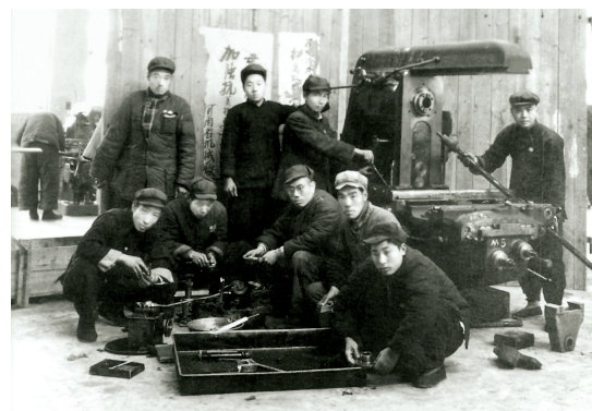
郑纺机第一代纺机职工。