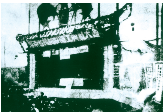
1949年11月13日，国营纺织工业企业郑州纺织机械厂举行开工典礼。