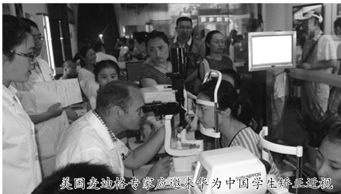
美国麦迪格专家应邀来华为中国学生矫正近视

2007年为让更多的学生摘掉近视眼镜，麦迪格先后在北京、天津、西安、武汉、大连、乌鲁木齐等城市开设了近30家直营店，200多家专业的眼视光中心；