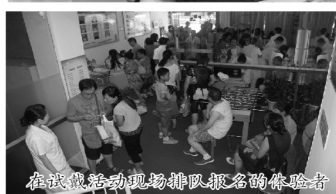
在试戴活动现场排队报名的体验者