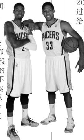
←步行者的保罗·乔治和格兰杰。

老鹰则可能是“团队篮球”在本赛季迎来的新贵宾,霍福德、米尔萨普、布兰德、科沃尔以及新主教练布登霍尔泽这些核心人员都重视团队合作。球队没有什么喜欢单打独斗的家伙,也许他们暂时不及老练的球队那样默契十足,但欣赏这支球队如何在场上用团队合作贯彻战术计划也应该是一件有趣的事情。