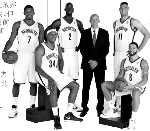
←若没有年龄和伤病的困扰,篮网是否就直接进入争冠行列了?

当然最有悬念的,还是布鲁克林篮网。这支俄罗斯土豪的球队,在保留了德隆·威廉姆斯、布鲁克·洛佩兹、乔·约翰逊等其他上赛季的核心球员的同时,又打包交易来加内特、皮尔斯与特里三员老将,而主帅却是年轻的基德——这样的组合将产生怎样的化学反应?