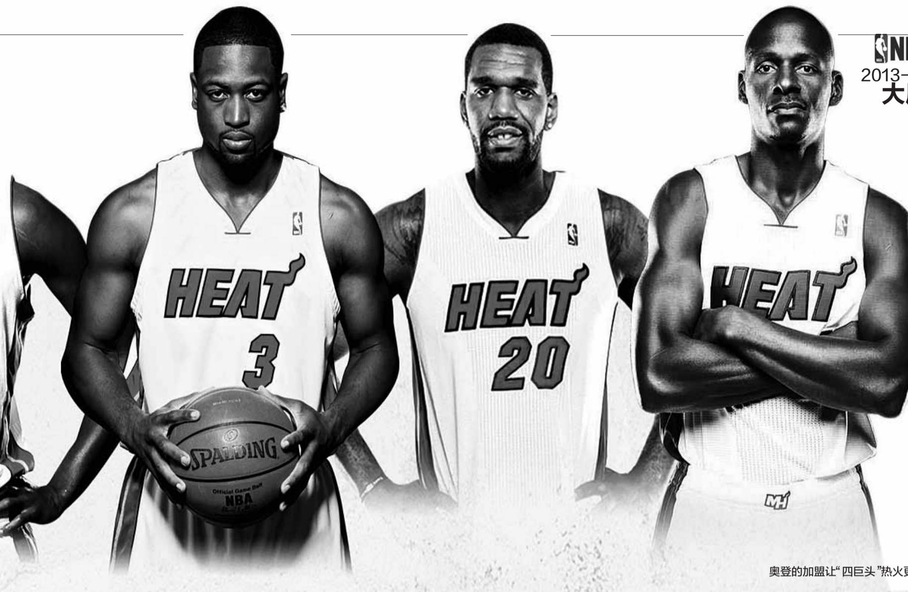
奥登的加盟让“四巨头”热火更强大。