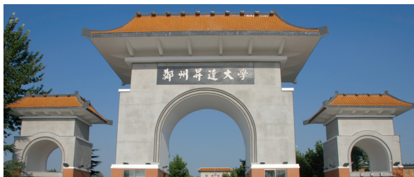
升达学院雄伟而深厚文化的建筑令人神往

升达学院一贯的坚持。制定励志向上的升达校训,注重师生优良素质培养,组织思想理论讲座,开展丰富多彩的文化、科技、体育活动,开展爱国主义教育、劳动教育、养成教育,着力培育浓郁的书香氛围和良好的文化环境。其目的就是努力打造升达人自强自立、奋勇拼搏的形象。