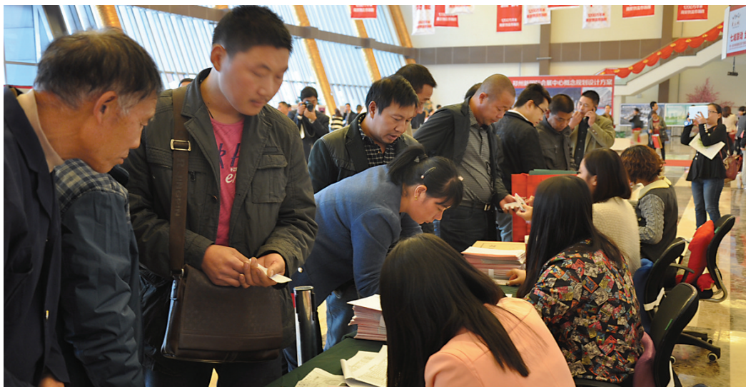
虽然还未到开盘当天,但华南城招商中心却聚集了众多客户前来咨询。

作为政府指定市场外迁承接地的郑州华南城,将于今日上午9点举行华南城汽摩配件市场开盘盛典。据悉,本次开盘隆重推出的是汽摩配件市场5A、5B精品交易区的商铺。统计数据显示,2012年郑州市机动车保有量突破200万,位列全国省会城市第四位。随着我省汽车市场的飞速发展,其产业链中的重要一环——汽配市场也随之升温。大环境的繁荣,为郑州汽配市场的发展提供了良好的机遇。 见习记者 何岳川