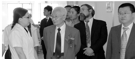
全国肛肠疾病救助工程专家组莅临河南站河南曙光医院

中国医师协会肛肠专业委员会副理事长董平教授介绍,早期结、直肠肿瘤愈后5年生存率可以达到70%~90%,而晚期则只有20%~30%。专家强调,要避免结、直肠肿瘤,便血、肛门疼痛及大便异常等症,及时到医院做一次彩色超导光电子肛肠镜检查则显得尤为重要。