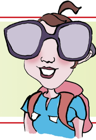
月儿弯弯wj (郑州19楼认证市民) 性别:女