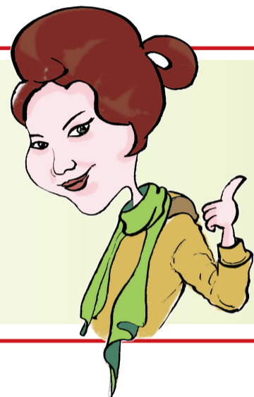
以为蒙上眼 (郑州19楼认证市民) 性别:女