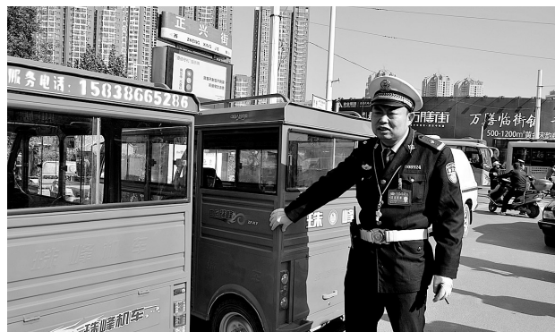
三大队查处非法营运的机动、电动三轮车。