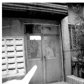
大门紧闭，人已经走了