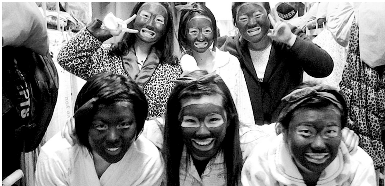
今年3月份一天，六姐妹做面膜前先来张合影。