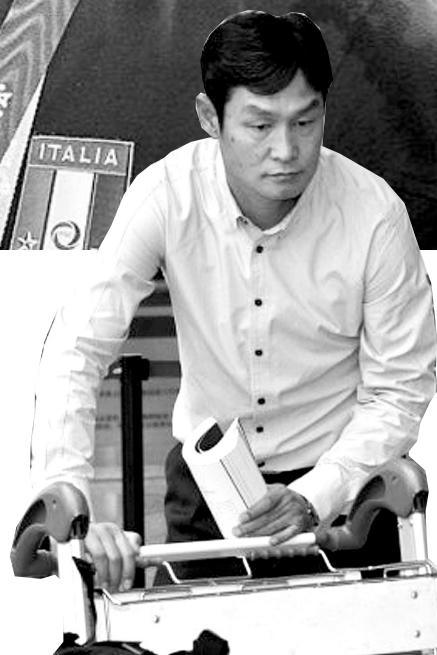
首尔FC抵达广州,主帅崔龙洙表情严肃。