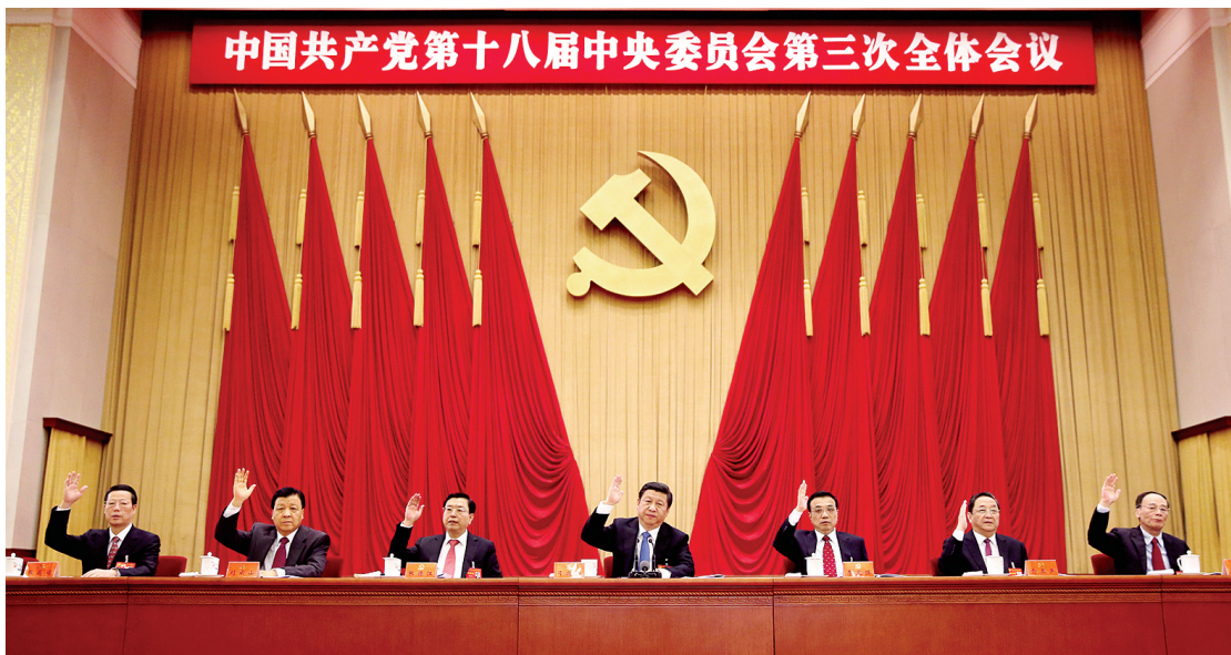
中国共产党第十八届中央委员会第三次全体会议于2013年11月9日至12日在北京举行。习近平、李克强、张德江、俞正声、刘云山、王岐山、张高丽等在主席台上。