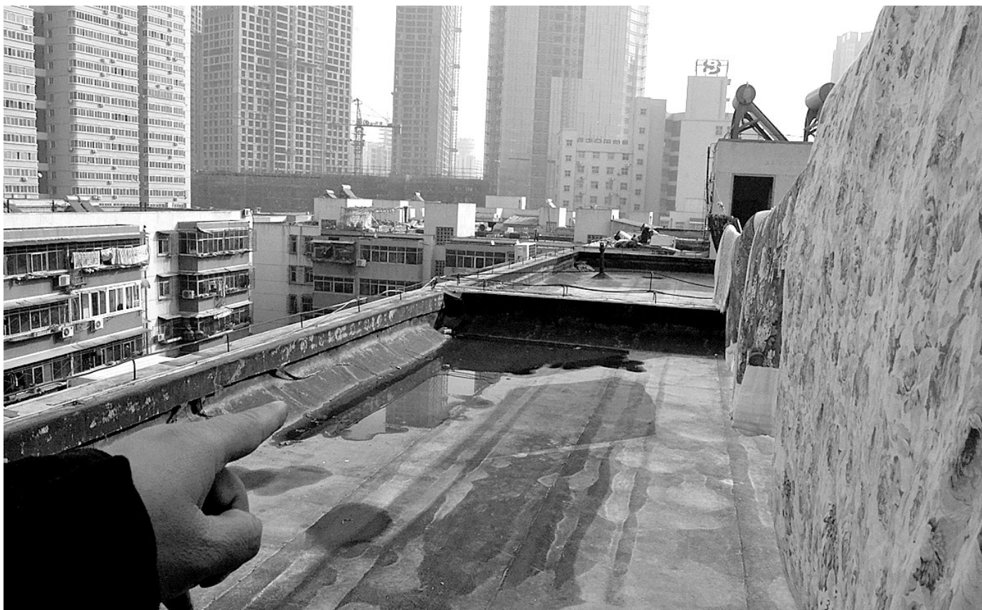
亚龙小区楼顶围墙大多不达标