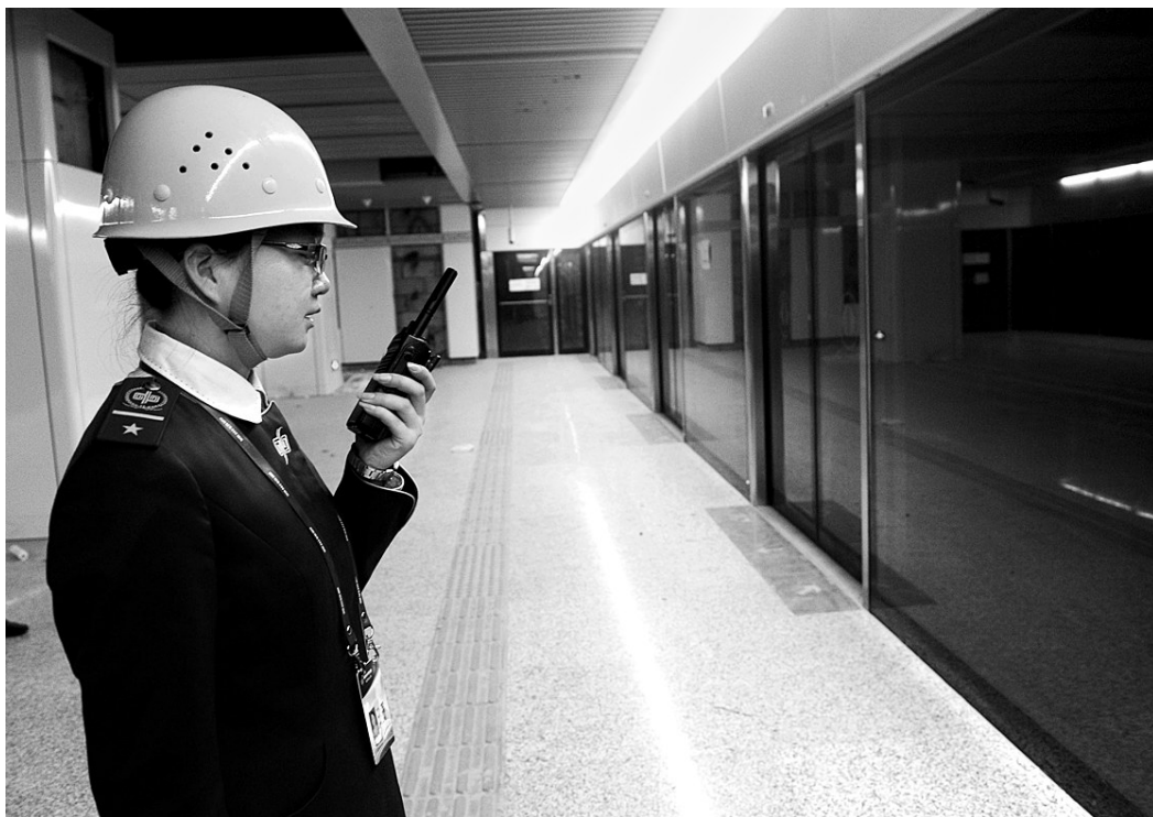
地铁到达时,站务员在车站内进行服务。