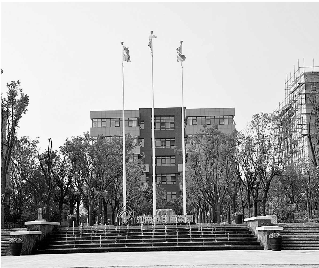
河南外包产业园初具规模,盛装起航

创新没有止境,发展不容怠慢,金水科教园区“扬长补短”,用技术创新刺激产业发展脉搏,优化科技资源配置,释放科技发展活力,促进产业链内生动力聚变,堪称河南集群建设中的“领跑者”。