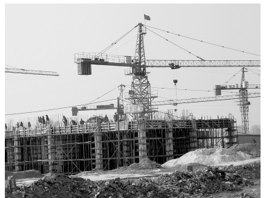
合村并城安置区建设阔步向前(周庄安置区)