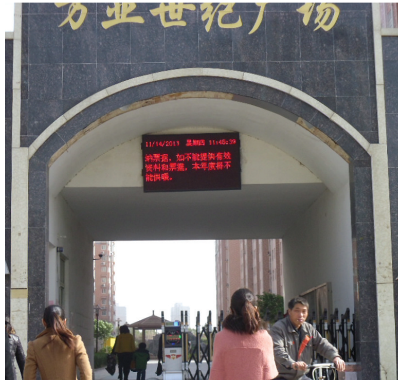
供暖费上涨牵动小区业主们的心