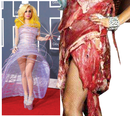
16 2010 Age 24 淡紫色未来感罩子