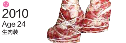
17 2010 Age 24 生肉装