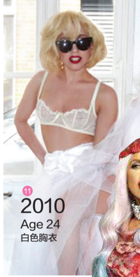
11 2010 Age 24 白色内衣