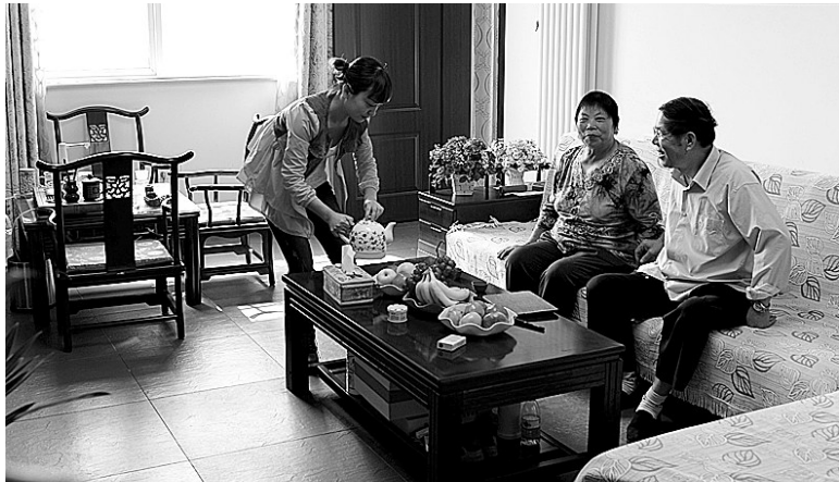
新密市农民入住新型农村社区

本报讯 楼房庭院错落有致,学校银行一应俱全,步入牛店镇张湾东宏社区仿佛走进了大城市。新密市像这样建成和在建的新型农村社区有64个,已建成住宅580万平方米,截至目前,已入住群众2.6万户10.5万人。