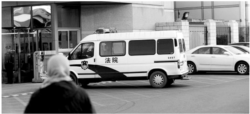
押解李某某等人的法警车驶入法院