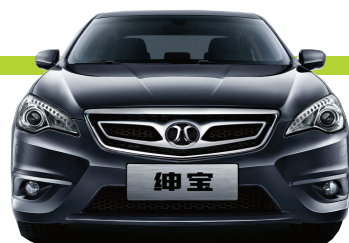
个性化需求崛起 “性能派”引领B级车市变革

随着80、90后消费群体逐渐成为车市主力,走中庸路线的车型对消费者的吸引力逐渐下降。相反,如小型SUV的异军突起,北汽绅宝等高性能个性化车型逐渐受到年轻用户的推崇。