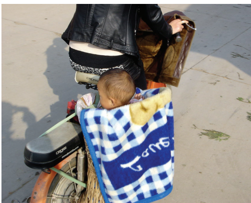
特殊“乘客”