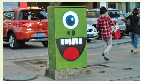
电箱也卖萌 戚景源 摄